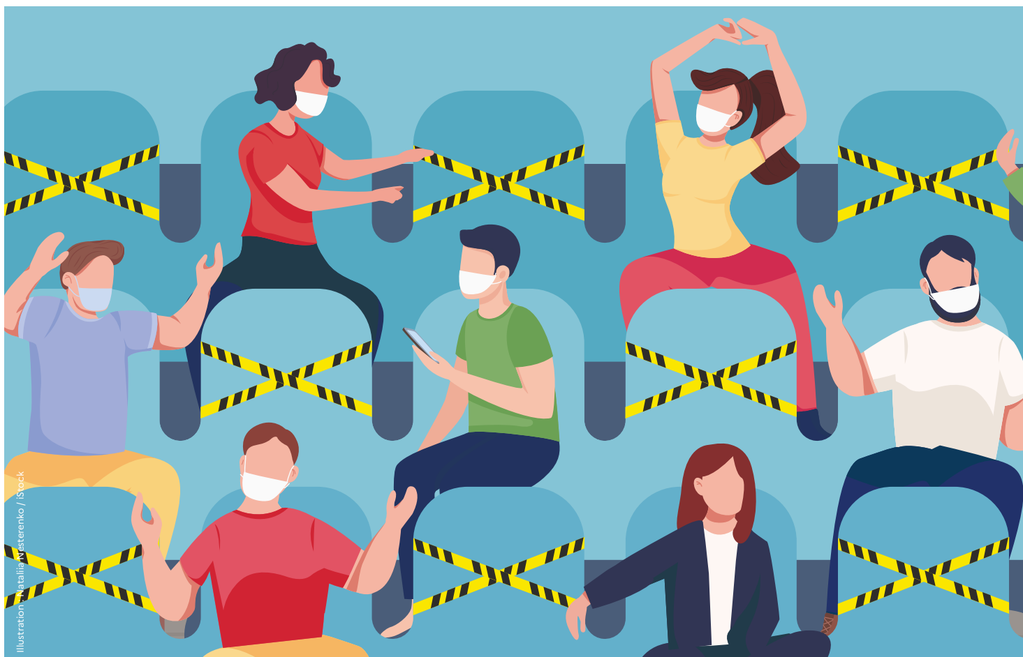
Illustration: Natalia Nesterenko / iStock